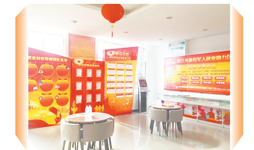
在中国海峡(晋江)人才市场专门设立的晋江市退役军人对外服务窗口