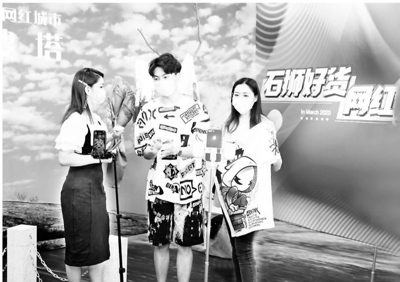
电商人才升级“网红”带货给力

接下来,石狮市将在本次网红直播专卖节基础上,常态化举办该项活动,帮助企业开拓新零售市场,壮大本土新型电子商务人才和网红人才队伍。同时,加快出台扶持直播产业发展的政策措施,在全国范围内引进网红直播人才和优质直播运