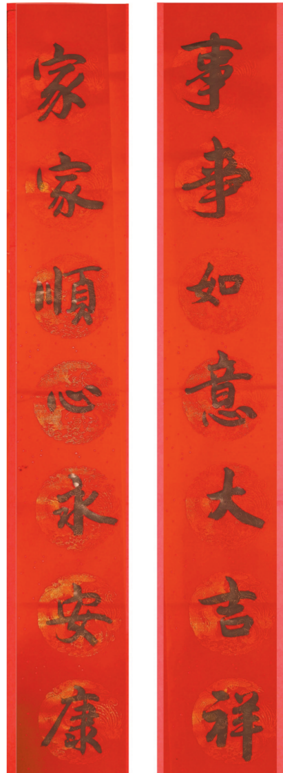
省政府办公厅邹平