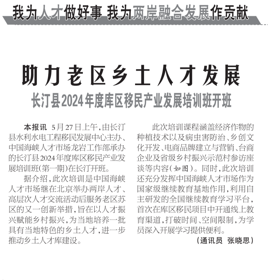
图为长汀县2024年度库区移民产业发展培训班开班