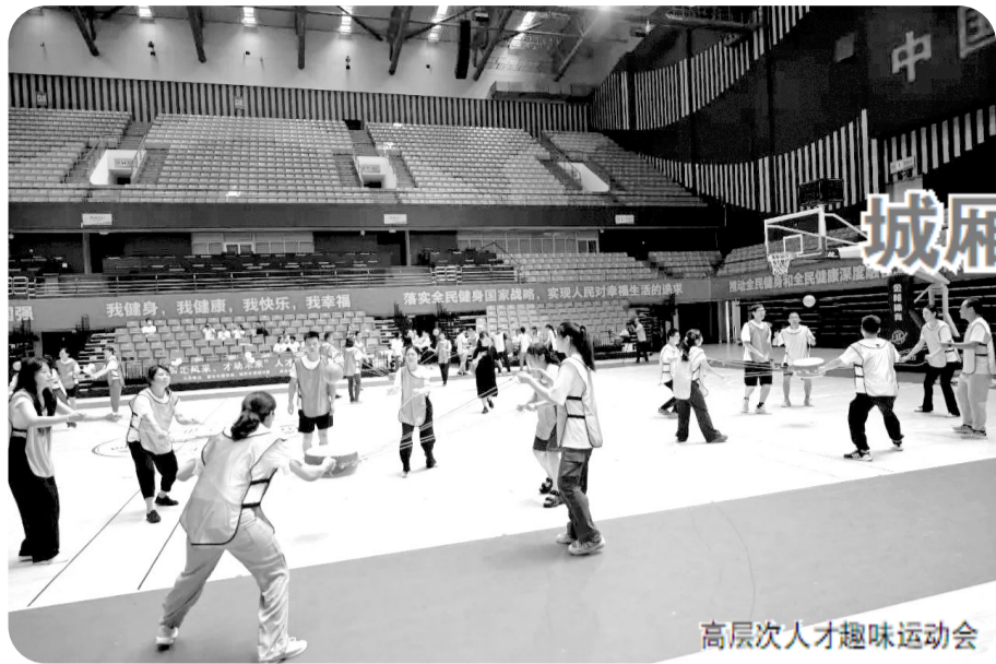
高层次人才趣味运动会